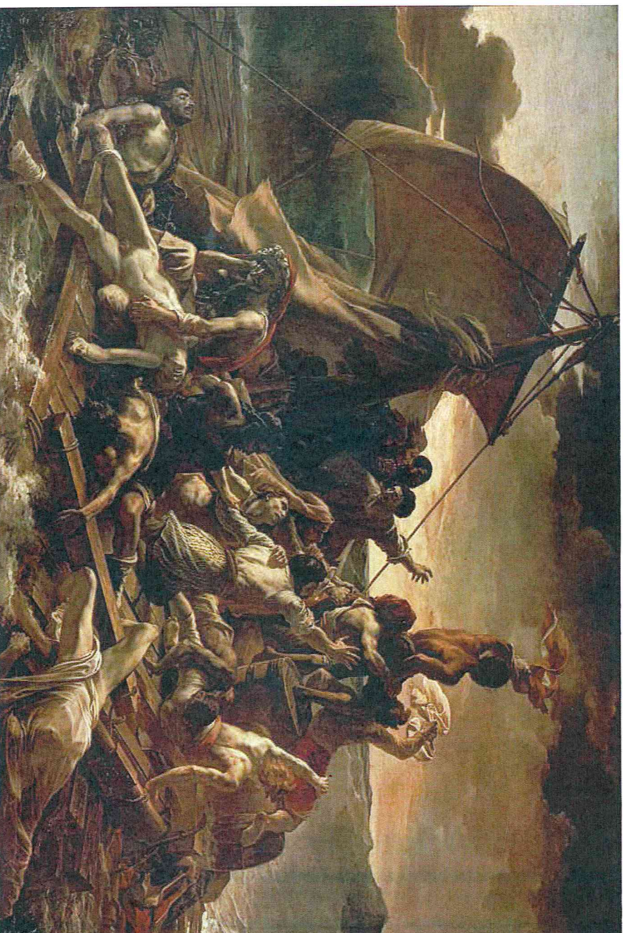
La zattera della medusa – olio su tela (491x716cm) di Théodore Gericault, 1818-19 – Museo del Louvre – Parigi

Uno strumento operativo per la mediazione dei conflitti e per l'integrazione MIUR Direzione Generale per lo studente, l'integrazione e la partecipazione. Avviso n. 981 30/09/2015 “Promozione del teatro in classe”